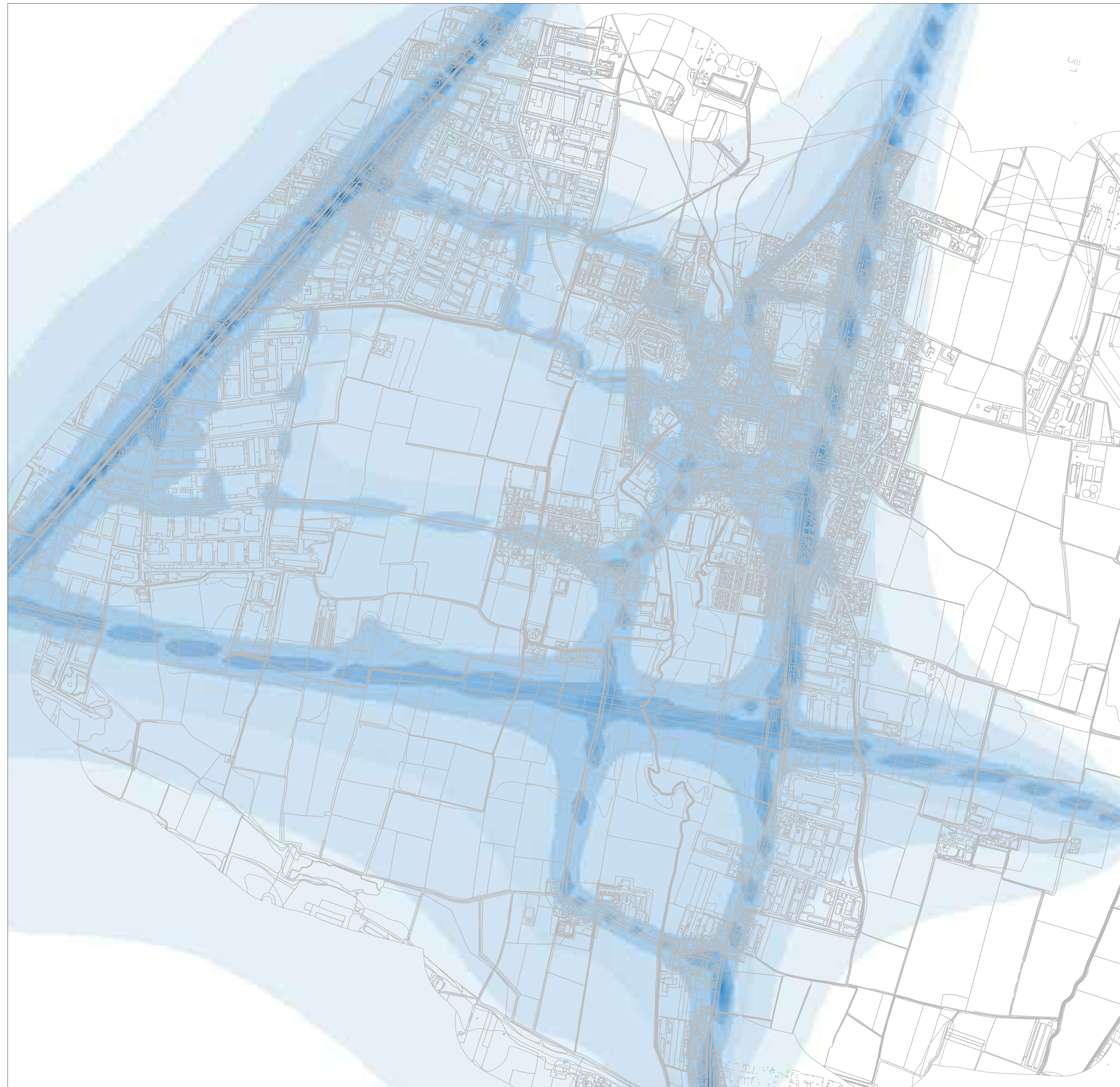
Valori medi annui - ug/m3